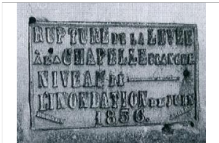
Auteur : EPL - DDT49