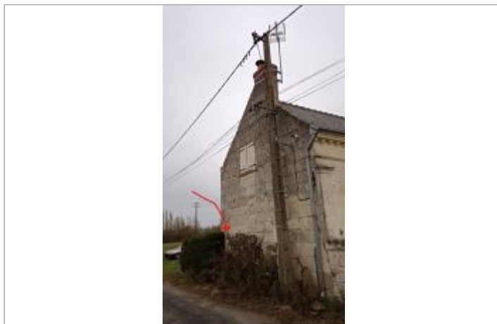
2025_Vue du site

Coordonnées WGS84 : X: 0.07700437 / Y: 47.25523650