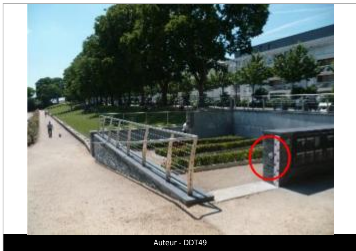
Auteur - DDT49

Code : SPCMLA_R_93_1 Date de mise à jour : 02/10/2018 Auteur : SPC MLA