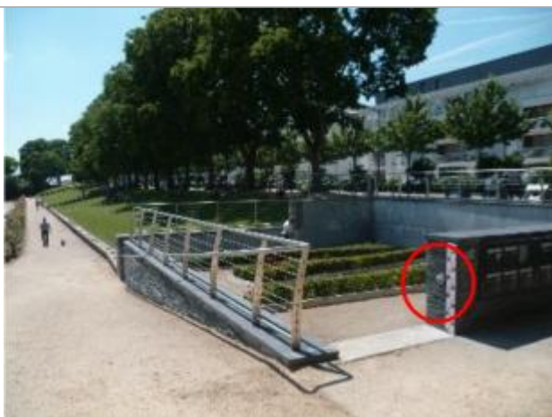
Auteur - DDT49

Altitude calculée de l'eau (en m) : 20.25