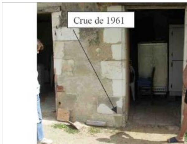
Atlas des Zones Inondables de Lathan - Laboratoire Régional des Ponts et Chaussées d'Angers - DDT49