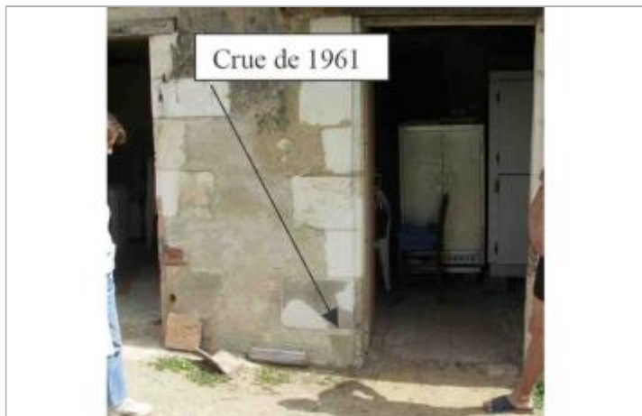
Atlas des Zones Inondables de Lathan - Laboratoire Régional des Ponts et Chaussées d'Angers - DDT49