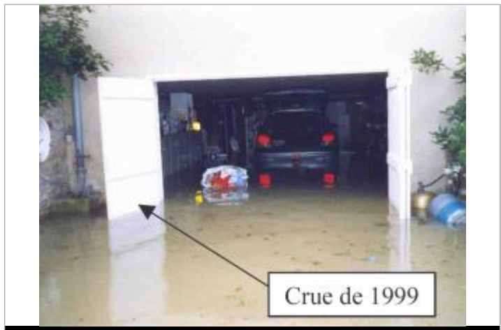
Atlas des Zones Inondables du Couasnon - Laboratoire Régional des Ponts et Chaussées d'Angers - DDT49

GÉNÉRAL Code : SPCMLA_R_44_1 Date de mise à jour : 02/11/2018 Auteur : SPC MLA