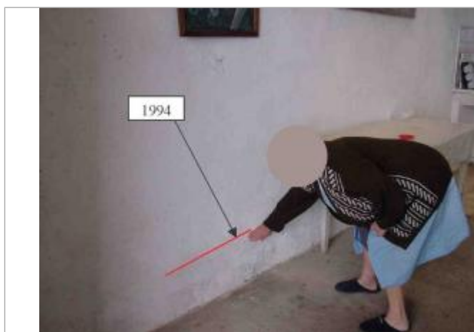
Atlas des Zones Inondables de l'Hyrome - Laboratoire Régional des Ponts et Chaussées d'Angers - DDT49