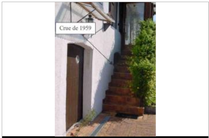
Atlas des Zones Inondables du Lys - Laboratoire Régional des Ponts et Chaussées d'Angers - DDT49

GÉNÉRAL Code : SPCMLA_R_29_1 Date de mise à jour : 02/10/2018 Auteur : SPC MLA