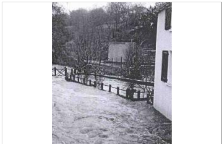
Atlas des Zones Inondables du Lys - Laboratoire Régional des Ponts et Chaussées d'Angers - DDT49

GÉNÉRAL Code : SPCMLA_R_29_2 Date de mise à jour : 02/10/2018 Auteur : SPC MLA