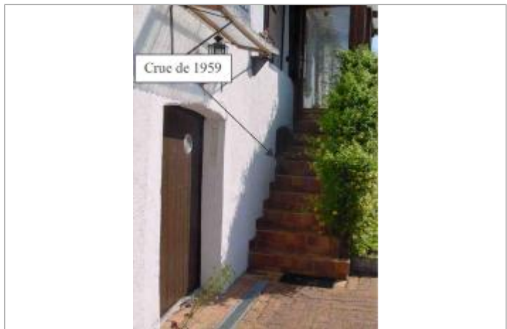
Atlas des Zones Inondables du Lys - Laboratoire Régional des Ponts et Chaussées d'Angers - DDT49

GÉNÉRAL Code : SPCMLA_R_29_1 Date de mise à jour : 02/10/2018 Auteur : SPC MLA