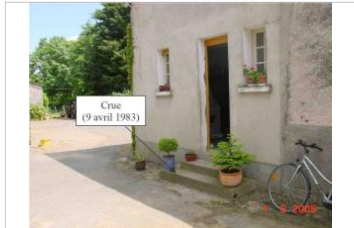
Atlas des Zones Inondables du Lys - Laboratoire Régional des Ponts et Chaussées d'Angers - DDT49

GÉNÉRAL Code : SPCMLA_R_28_1 Date de mise à jour : 02/10/2018 Auteur : SPC MLA