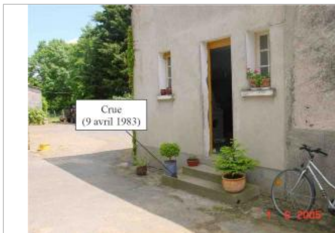
Atlas des Zones Inondables du Lys - Laboratoire Régional des Ponts et Chaussées d'Angers - DDT49