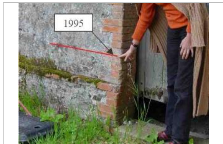
Atlas des Zones Inondables de l'Hyrome - Laboratoire Régional des Ponts et Chaussées d'Angers - DDT49