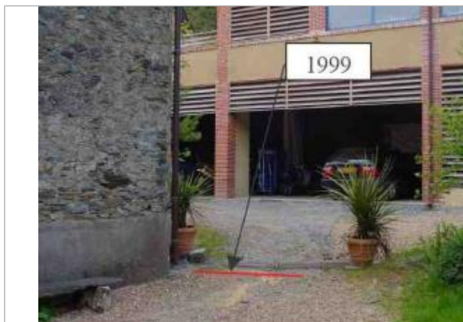
Atlas des Zones Inondables de l'Hyrome - Laboratoire Régional des Ponts et Chaussées d'Angers - DDT49