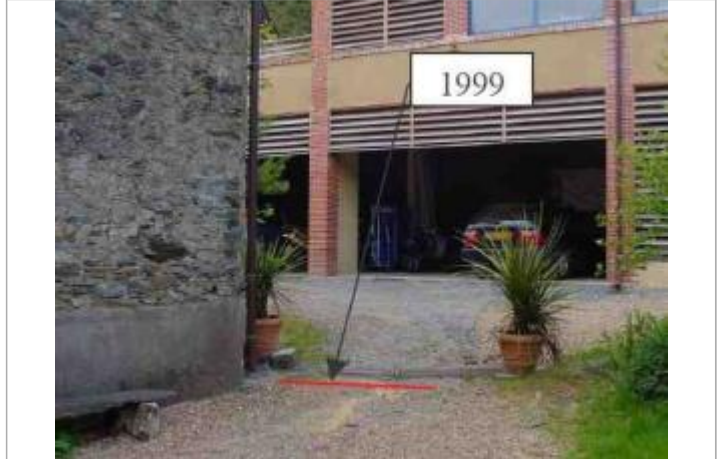
Atlas des Zones Inondables de l'Hyrome - Laboratoire Régional des Ponts et Chaussées d'Angers - DDT49