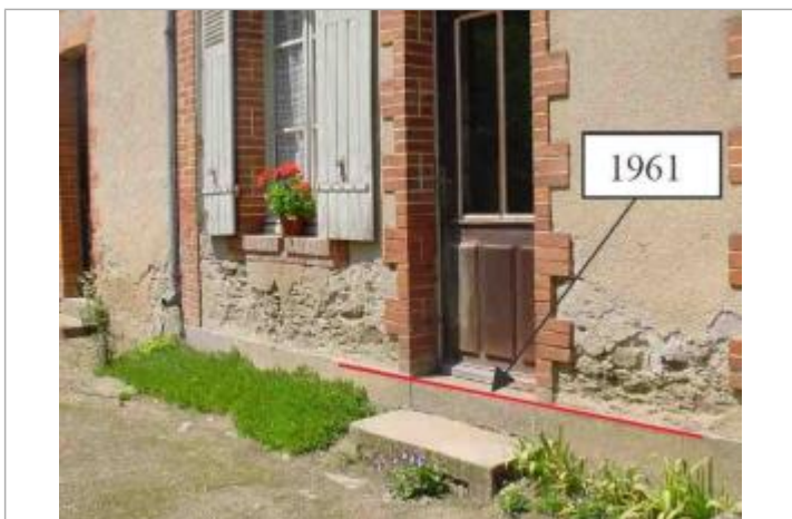
Atlas des Zones Inondables de l'Hyrôme - Laboratoire Régional des Ponts et Chaussées d'Angers - DDT49