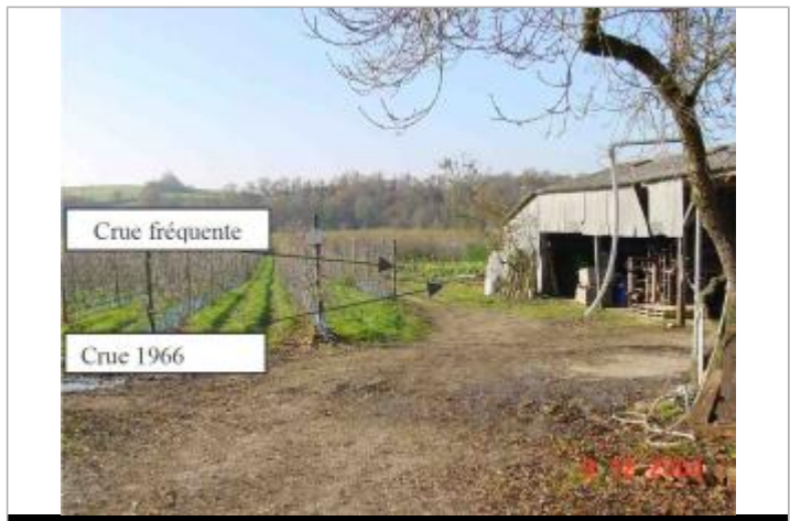
Atlas des Zones Inondables du Layon - Laboratoire Régional des Ponts et Chaussées d'Angers - DDT49

GÉNÉRAL Code : SPCMLA_R_20_1 Date de mise à jour : 02/11/2018 Auteur : SPC MLA