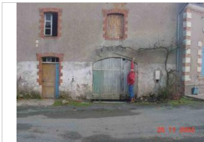
Atlas des Zones Inondables du Layon - Laboratoire Régional des Ponts et Chaussées d'Angers - DDT49