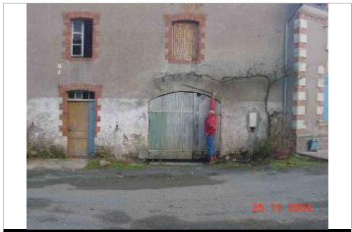
Atlas des Zones Inondables du Layon - Laboratoire Régional des Ponts et Chaussées d'Angers - DDT49

GÉNÉRAL Code : SPCMLA_R_18_1 Date de mise à jour : 24/10/2018 Auteur : SPC MLA