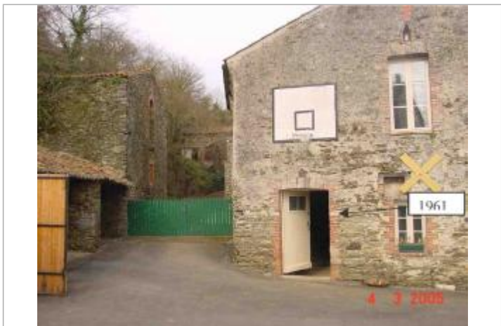
Atlas des Zones Inondables de l'Evre - Laboratoire Régional des Ponts et Chaussées d'Angers - DDT49

GÉNÉRAL Code : SPCMLA_R_11_1 Date de mise à jour : 07/10/2018 Auteur : SPC MLA