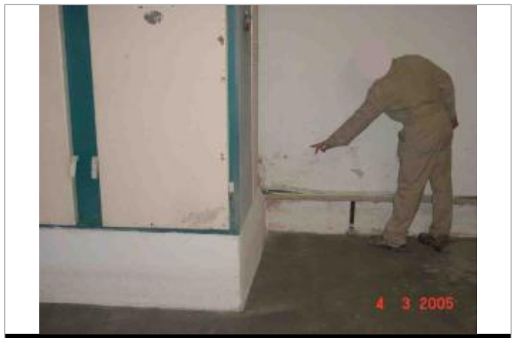
Atlas des Zones Inondables de l'Evre - Laboratoire Régional des Ponts et Chaussées d'Angers - DDT49

GÉNÉRAL Code : SPCMLA_R_8_1 Date de mise à jour : 24/07/2025 Auteur : SPC MLA