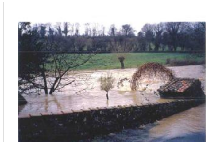
Atlas des Zones Inondables de l'Evre - Laboratoire Régional des Ponts et Chaussées d'Angers - DDT49