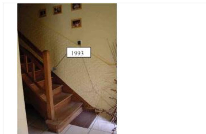
Atlas des Zones Inondables de l'Evre - Laboratoire Régional des Ponts et Chaussées d'Angers - DDT49