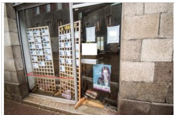
Laisse de crue sur la vitrine du 21 rue de Paris - 01

Code : MorlaixCo_11 Date de mise à jour : Auteur : Morlaix Communauté 23/09/2019