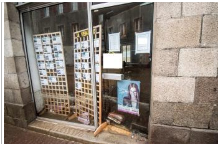
Vitrine du 21 rue de Paris