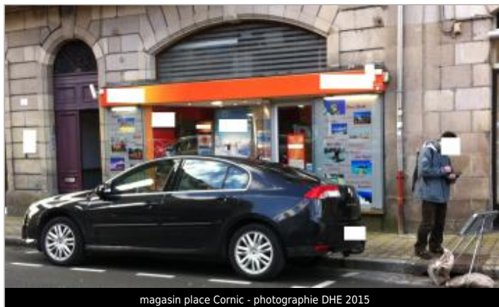
magasin place Cornic - photographie DHE 2015