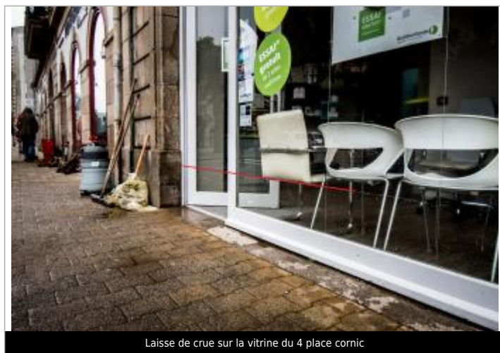
Laisse de crue sur la vitrine du 4 place cornic

Altitude calculée de l'eau (en m) : 5.96 m