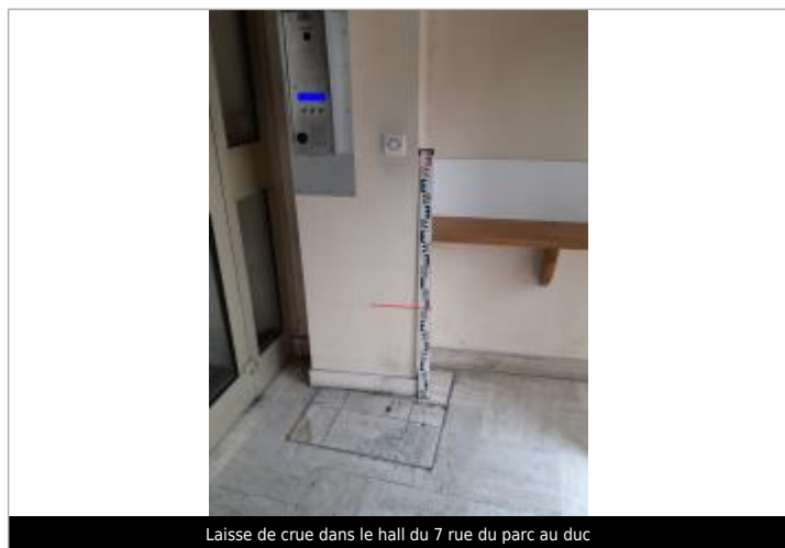
Laisse de crue dans le hall du 7 rue du parc au duc