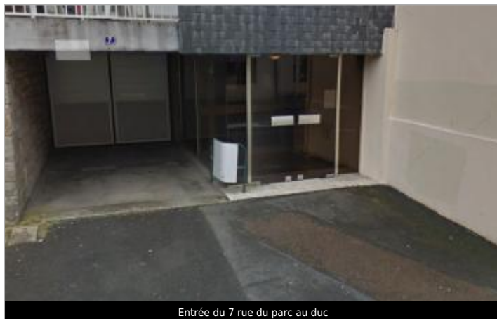
Entrée du 7 rue du parc au duc

Coordonnées WGS84 : X: -3.82151310 / Y: 48.57497100