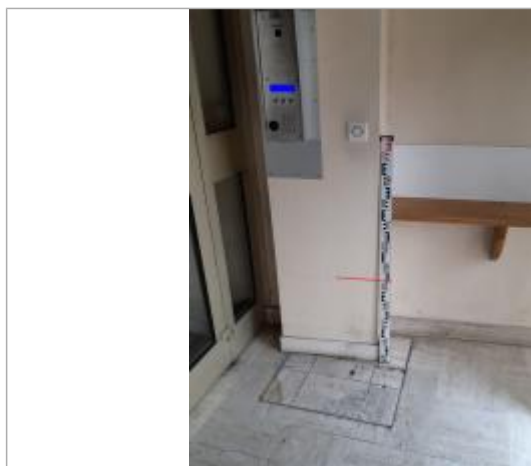
Laisse de crue dans le hall du 7 rue du parc au duc