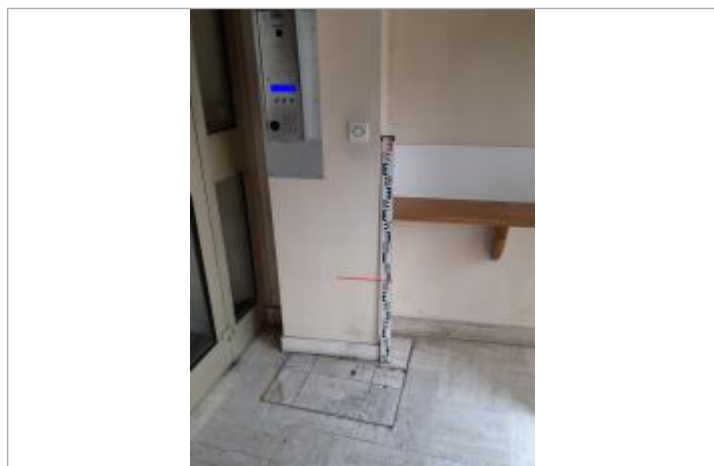
Laisse de crue dans le hall du 7 rue du parc au duc