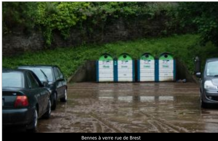
Bennes à verre rue de Brest