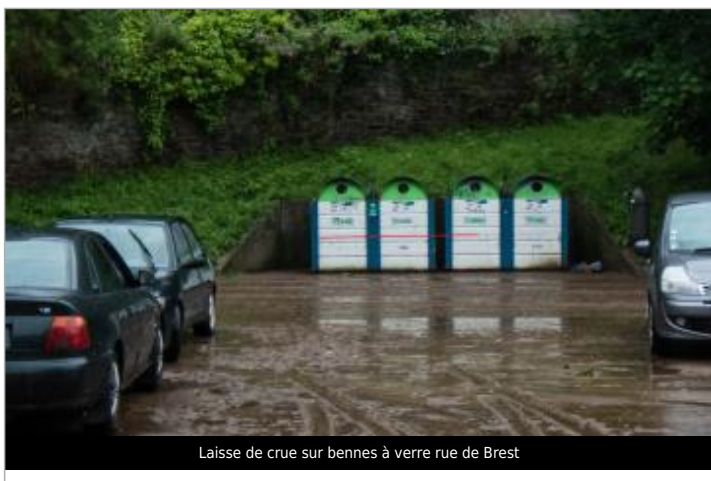
Laisse de crue sur bennes à verre rue de Brest

Maximum de l'inondation : Oui Visibilité : Oui État du repère : Bon Pérennité : Aucune Repère calculé : Non PHEC : Non