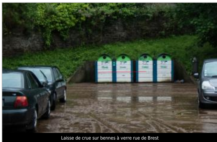
Laisse de crue sur bennes à verre rue de Brest