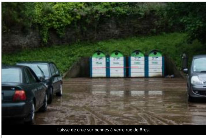
Laisse de crue sur bennes à verre rue de Brest