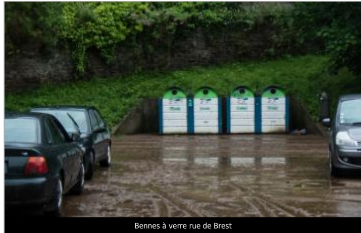
Bennes à verre rue de Brest