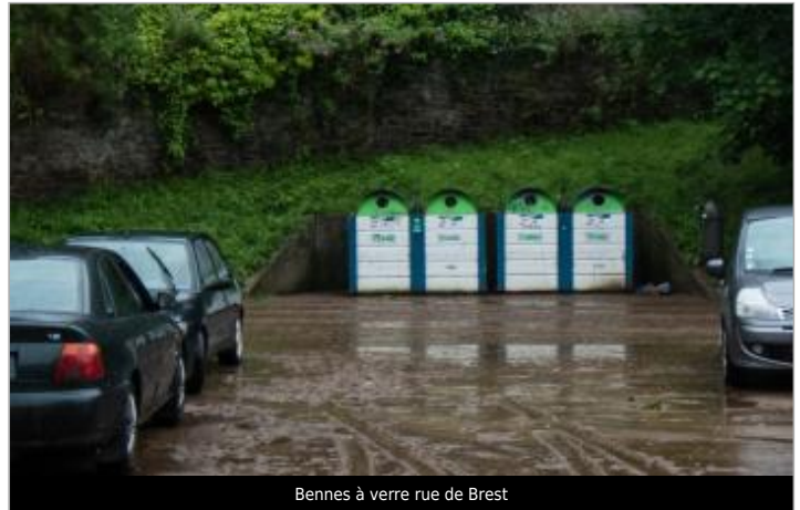
Bennes à verre rue de Brest