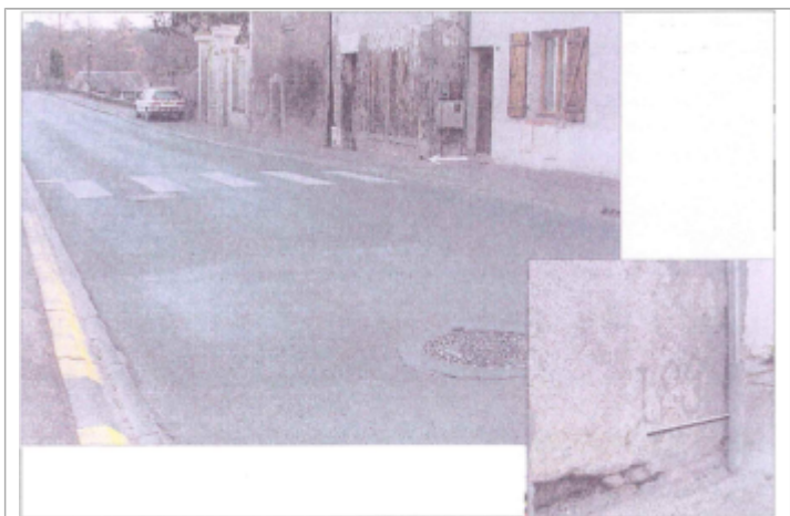
Site et repère en 2003

GÉNÉRAL Code : WEB_R_201809270552 Date de mise à jour : 27/09/2018 Auteur : SPC LCI