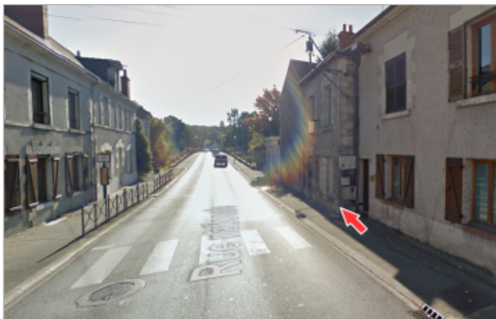
Vue du site

GÉOLOCALISATION Coordonnées WGS84 : X: 1.38313700 / Y: 47.52564750 Coordonnées RGF93 (Lambert 93) X: 578344.34 / Y: 6715165.48 Coordonnées RGF93 (ETRS89) : X: 1.383137 / Y: 47.5256475 Code Hydro: K4-0220 Rive de référence: Droite