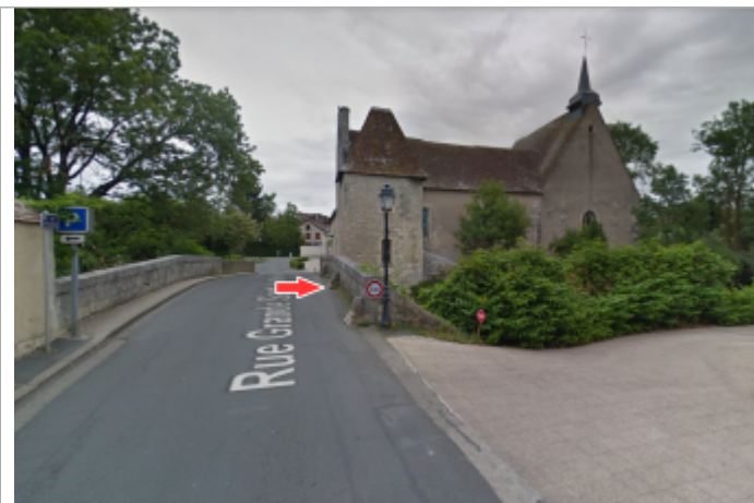
Vue du site