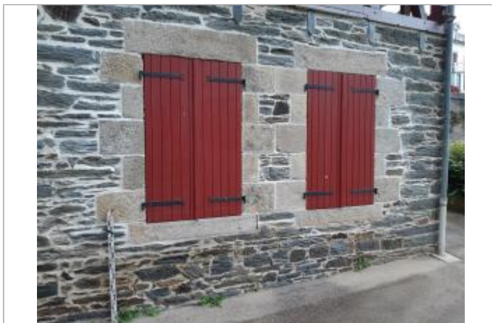
Bâtiment de la Tannerie, 10 rue de la tannerie