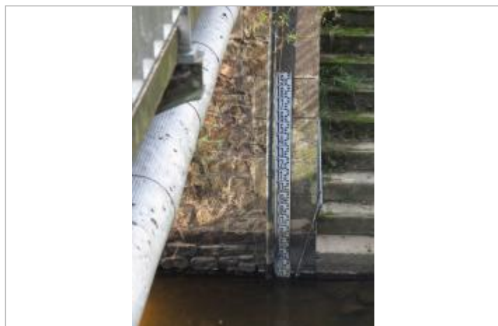
Echelle limnimétriques de la station Vigicrues du Garun à Iffendic

Altitude calculée de l'eau (en m) : 42.833 m