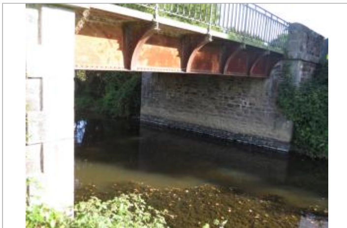
Vue du site de la station Vigicrues sous le pont de la RD 31