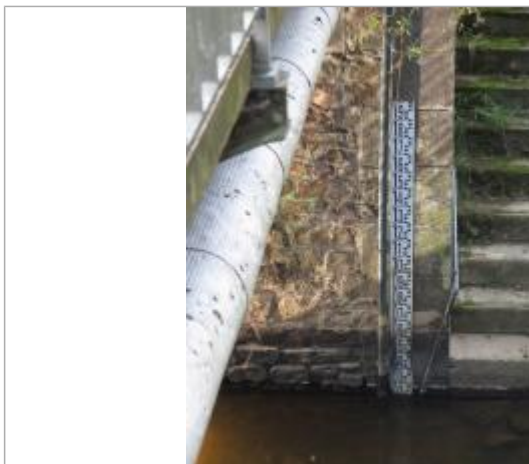
Echelle limnimétriques de la station Vigicrues du Garun à Iffendic

Altitude calculée de l'eau (en m) : 43.023 m