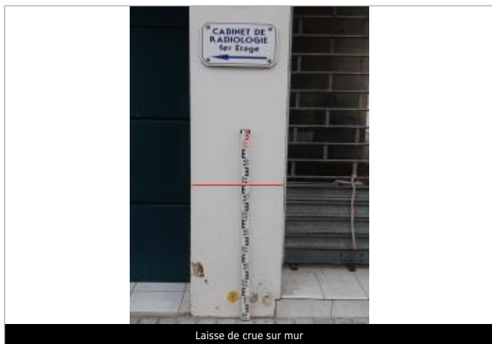
Laisse de crue sur mur

SOURCE DE REPÉRAGE : VISITE TERRAIN MORLAIX COMMUNAUTÉ - 19/09/2018