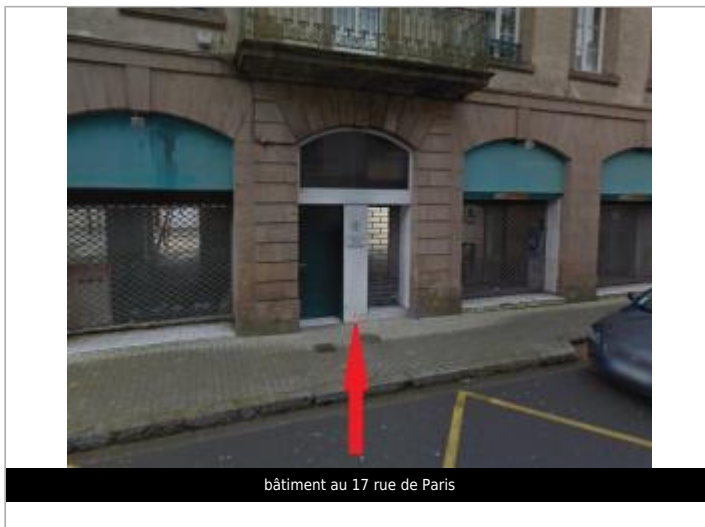
bâtiment au 17 rue de Paris