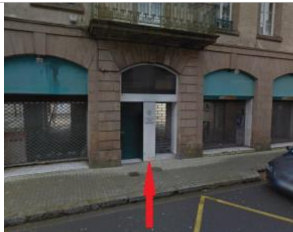
bâtiment au 17 rue de Paris

Coordonnées WGS84 : X: -3.82367840 / Y: 48.57591900