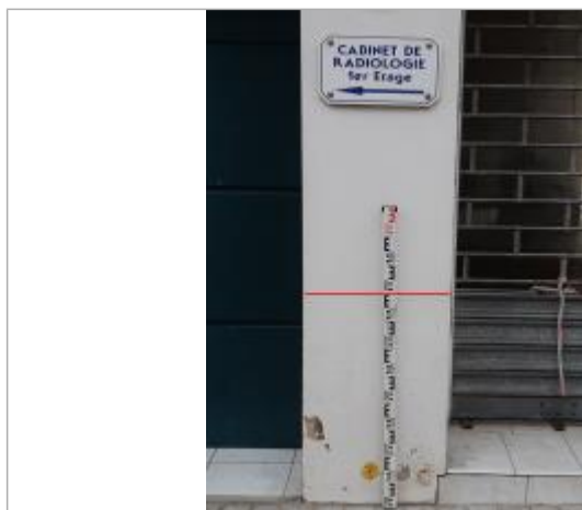
Laisse de crue sur mur

Altitude calculée de l'eau (en m) : 10.94 m