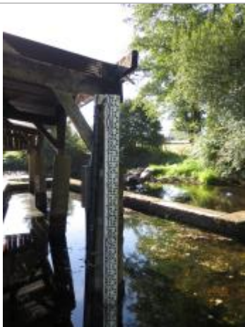
Vue du site de la station Vigicruces de Gael

Altitude calculée de l'eau (en m) : 59.219 m