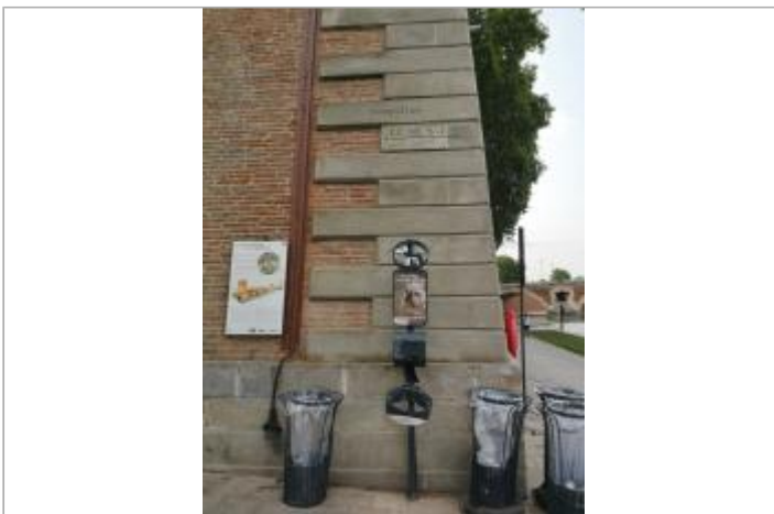
Vue du site (2023)

GÉOLOCALISATION Coordonnées WGS84 : X: 1.43910120 / Y: 43.60092700 Coordonnées RGF93 (Lambert 93) X: 573937.82 / Y: 6279231.85 Coordonnées RGF93 (ETRS89) : X: 1.4391012 / Y: 43.600927 Code Hydro: O---0000 Rive de référence: Droite