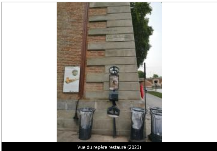
Vue du repère restauré (2023)

MARQUE Texte : INONDATION LE 30 MAI 1835 Maximum de l'inondation : Oui Visibilité : Oui État du repère : Mauvais Pérennité : Moyenne