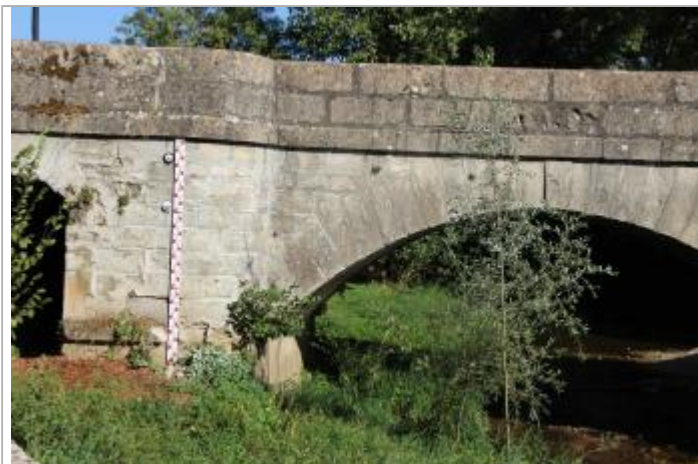
GAIL-2 : l'Aveyron au niveau du pont de Gaillac (D 95)