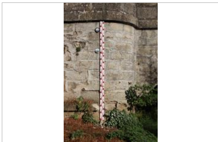
repère correspondant au niveau atteint par la crue du 26/10/1979 (macaron du bas sur la photo)