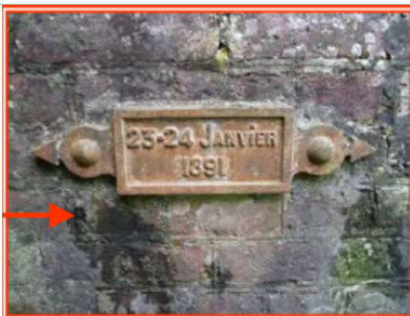
Amont du pont rue d'Avroult