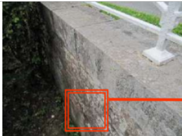
Pont rue d'Avroult