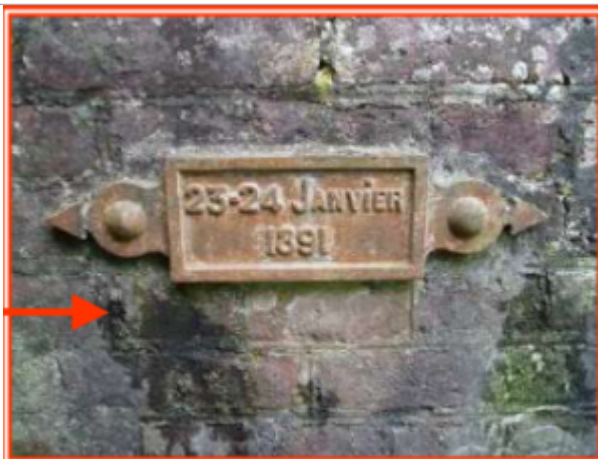
Amont du pont rue d'Avroult