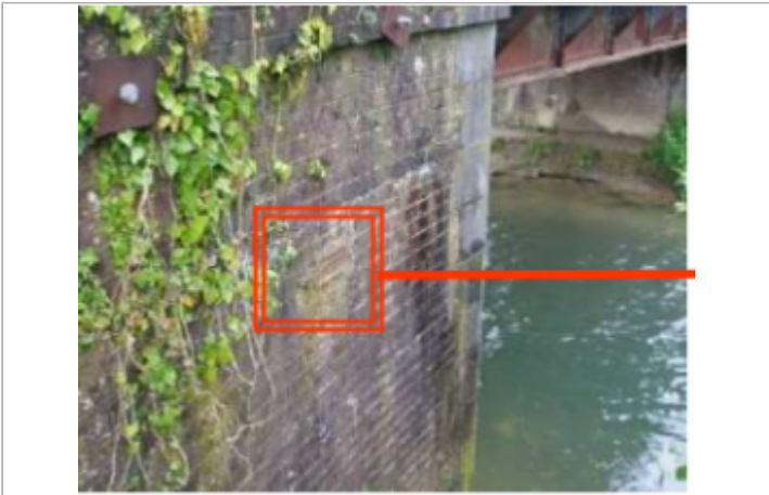
Pont rue du Marais