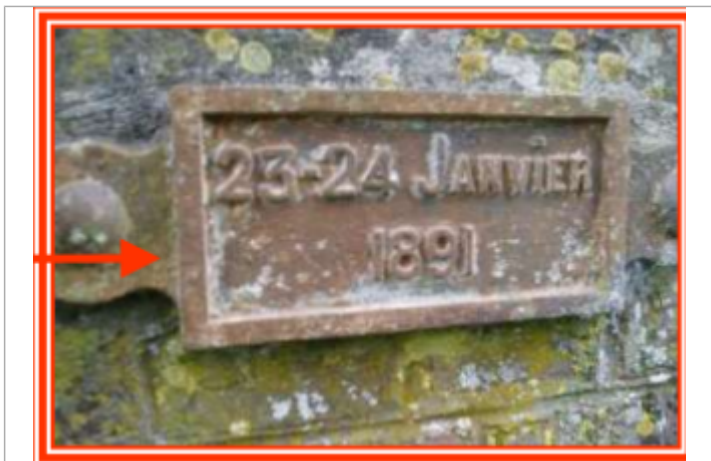
Plaque en amont du pont