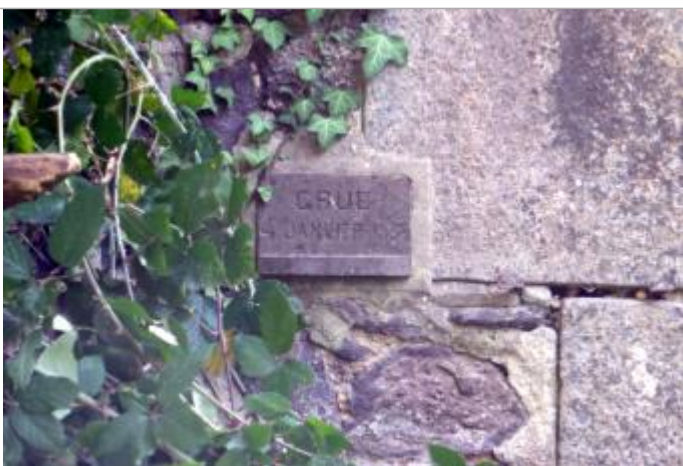
plaque commémorative de la crue du 4 janvier 1936