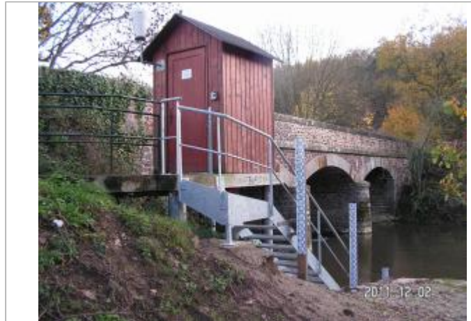
Vue du site de la station Vigicrues de Montfort sur Meu Abbaye