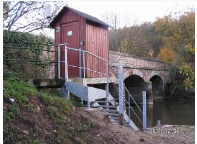
Vue du site de la station Vigicrues de Montfort sur Meu Abbaye

Code Hydro: J73-0300 Rive de référence: Gauche