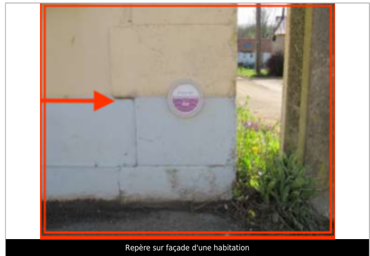
Repère sur façade d'une habitation

MARQUE Visibilité : Oui État du repère : Bon Pérennité : Longue