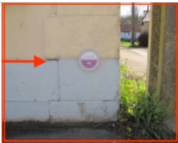
Repère sur façade d'une habitation