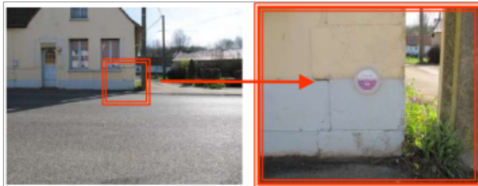
Façade habitation _ rue de l'Aa à Bourthes

Coordonnées WGS84 : X: 1.93440700 / Y: 50.60630600