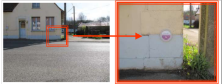
Façade habitation _ rue de l'Aa à Bourthes

GÉOLOCALISATION Coordonnées WGS84 : X: 1.93440700 / Y: 50.60630600 Coordonnées RGF93 (Lambert 93) X: 624443.8 / Y: 7057093.92 Coordonnées RGF93 (ETRS89) : X: 1.934407 / Y: 50.606306 Code Hydro: E4--001- Rive de référence: Droite