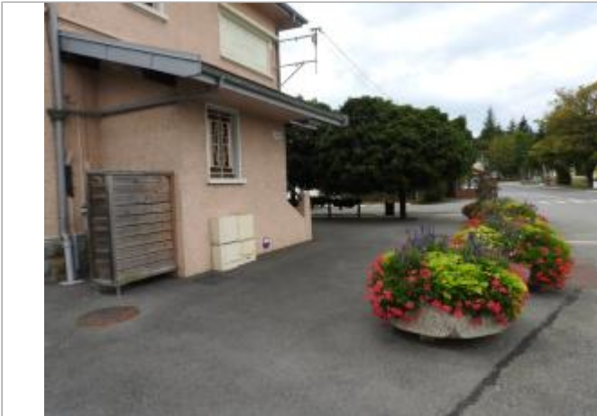
Crue du ruisseau Le Lanna à proximité de la gare