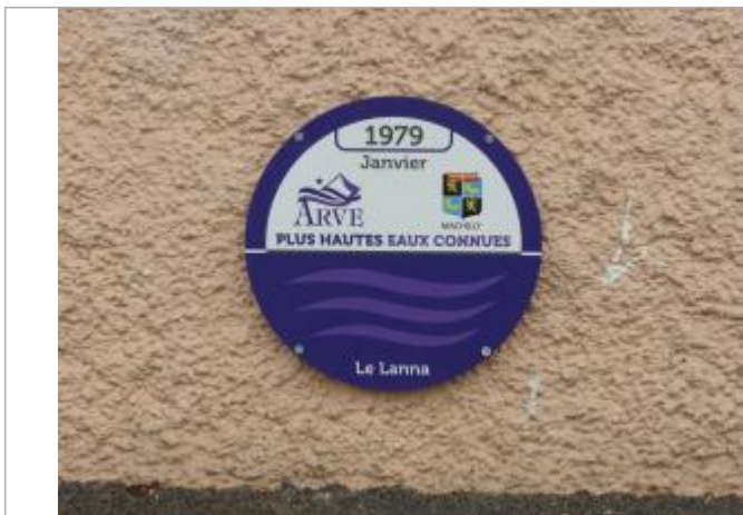
Crue du ruisseau Le Lanna en Janvier 1979

Maximum de l'inondation : Oui Visibilité : Oui État du repère : Bon Pérennité : Longue