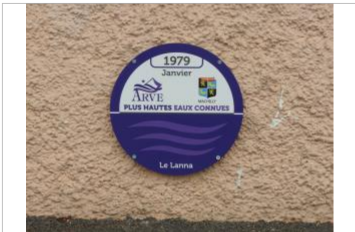
Crue du ruisseau Le Lanna en Janvier 1979

Maximum de l'inondation : Oui Visibilité : Oui État du repère : Bon Pérennité : Longue