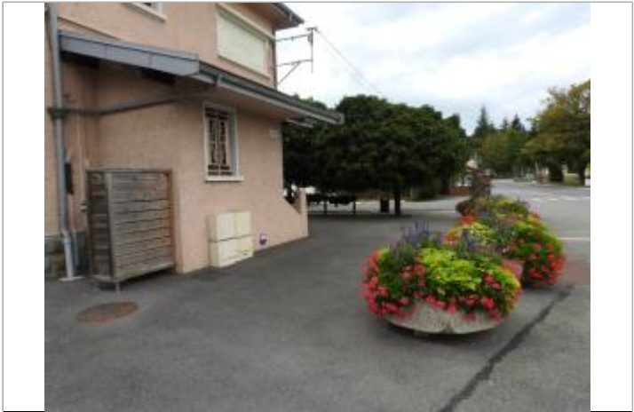
Crue du ruisseau Le Lanna à proximité de la gare