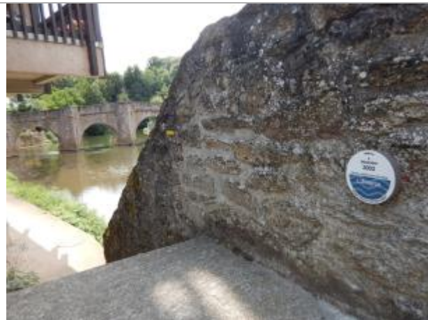
RA-8 : l'Aveyron place de la Mairie (mûr escalier d'accès aux berges)