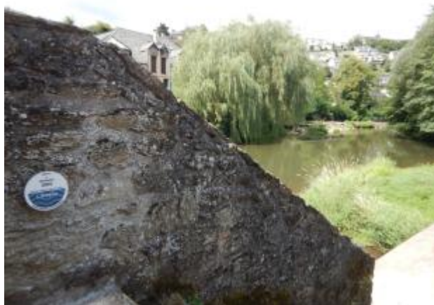
Repère du niveau atteint par la crue du 4 décembre 2003