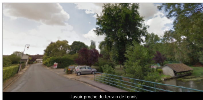
Lavoir proche du terrain de tennis