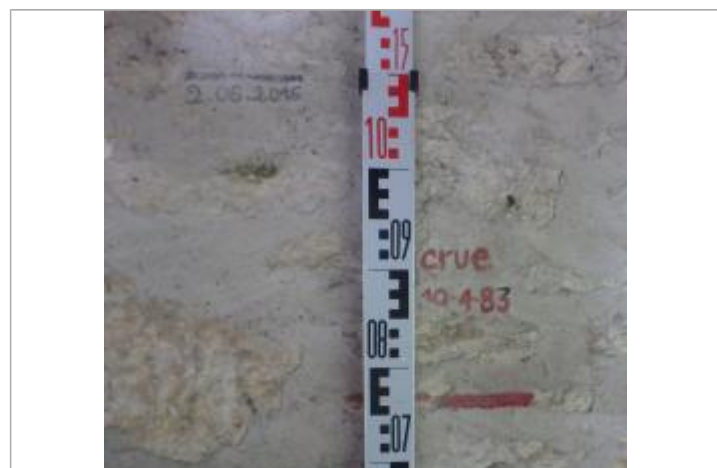
Trait de peinture rouge