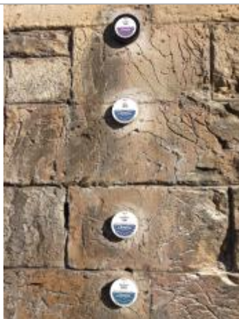
repère correspondant au niveau atteint par la crue du 03/03/1930 (2ème macaron en partant du haut sur la photo)