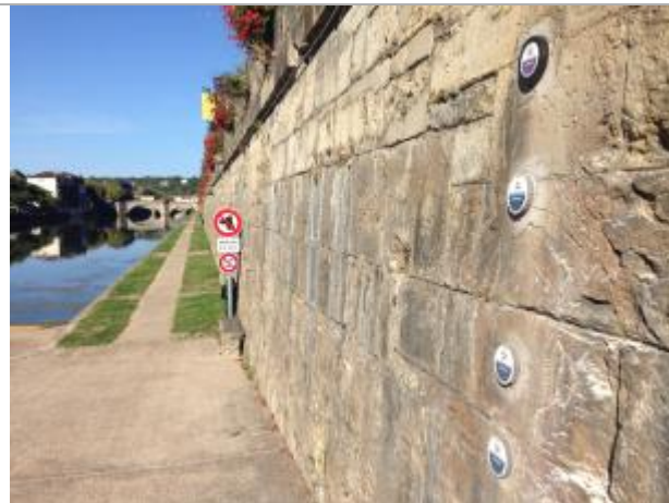
VDR-2 : echelle de crues des Bains Douches