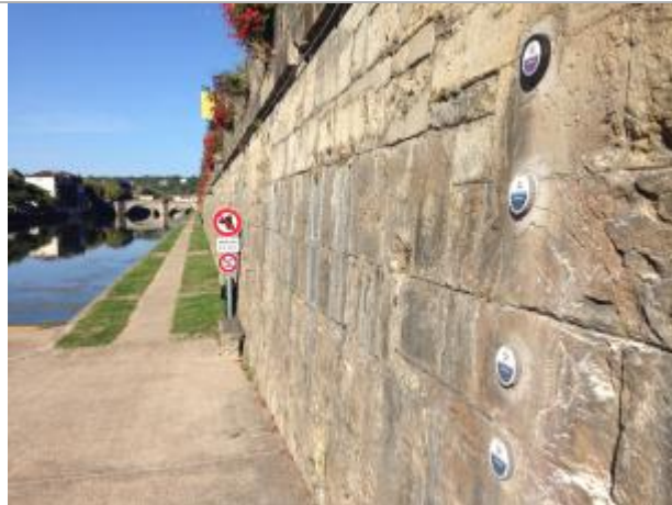
VDR-2 : echelle de crues des Bains Douches