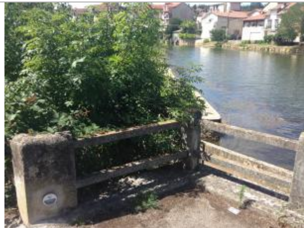
L'Aveyron au niveau du Quai Adolphe Poulit, au dessus de la passe à poissons