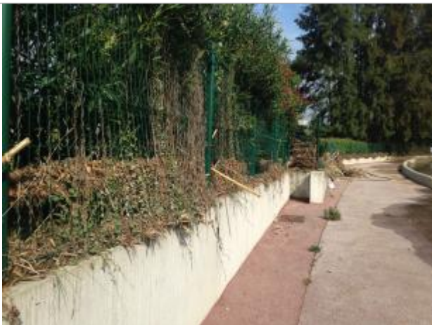
Repère du niveau atteint par la crue du 4 octobre 1961