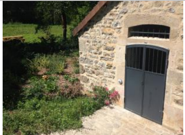
VDR-7 : Le ruisseau de Notre-Dame au niveau de la Fontaine de Treize-Pierres

Coordonnées RGF93 (ETRS89) : X: 2.0223458 / Y: 44.3601305