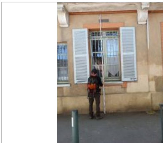
Photo du repère - mesure 3,57 m