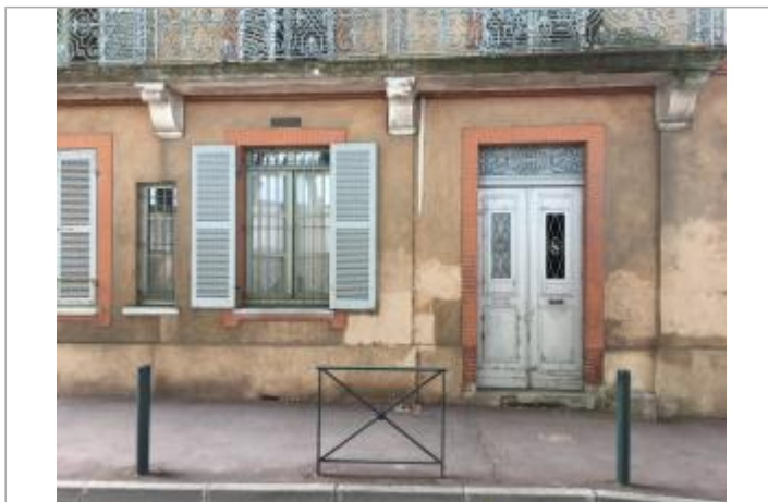
Vue depuis la rue Laganne