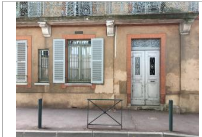
Vue depuis la rue Laganne

Coordonnées WGS84 : X: 1.43657916 / Y: 43.59752010