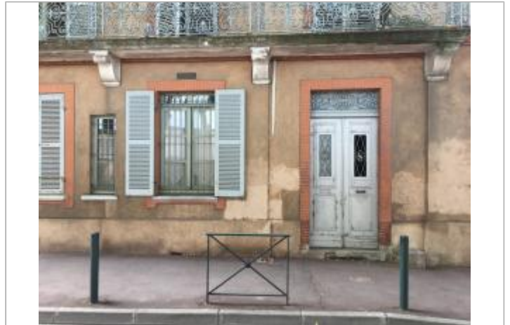
Vue depuis la rue Laganne