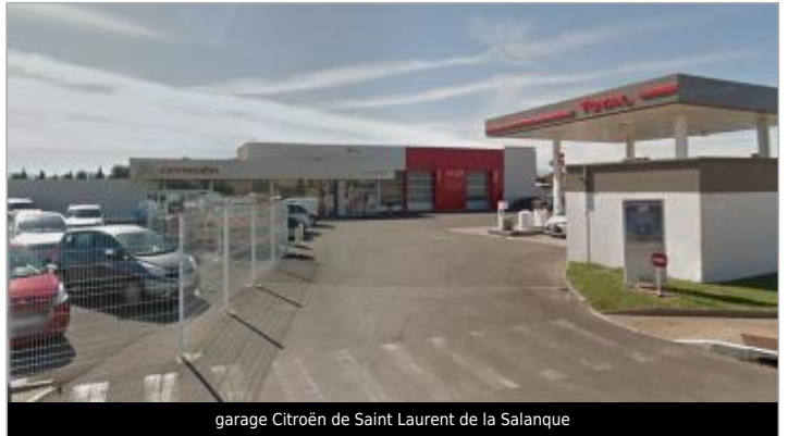
garage Citroën de Saint Laurent de la Salanque

GÉOLOCALISATION Coordonnées WGS84 : X: 3.00047590 / Y: 42.77239400 Coordonnées RGF93 (Lambert 93) X: 700038.99 / Y: 6185873.2 Coordonnées RGF93 (ETRS89) : X: 3.0004759 / Y: 42.772394 Code Hydro: Y06740 Rive de référence: Non renseigné