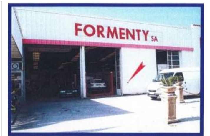
facade du garage Citroën

MARQUE Maximum de l'inondation : Oui Visibilité : Non État du repère : Disparu Pérennité : Aucune