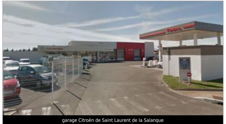
garage Citroën de Saint Laurent de la Salanque