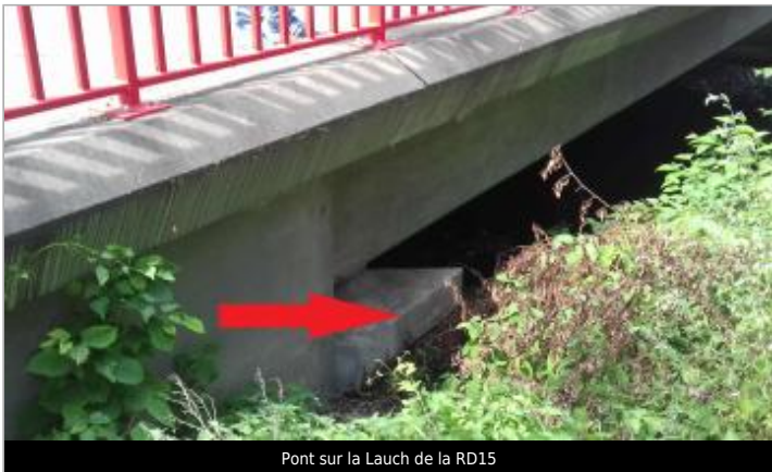
Pont sur la Lauch de la RD15

GÉOLOCALISATION Coordonnées WGS84 : X: 7.29138430 / Y: 47.91362300 Coordonnées RGF93 (Lambert 93) X: 1020413.52 / Y: 6765734.47 Coordonnées RGF93 (ETRS89) : X: 7.2913843 / Y: 47.913623 Code Hydro: A15-0200 Rive de référence: