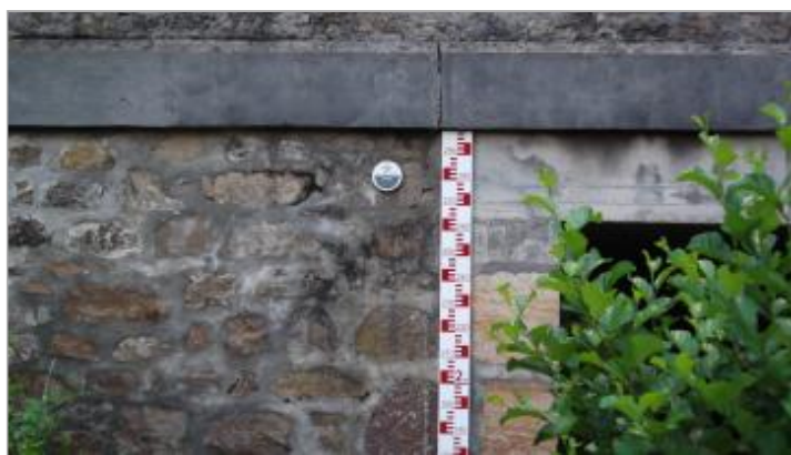
MONT-2 L'Assou à Monteils (pont RD 47) - crue du 14 décembre 1981